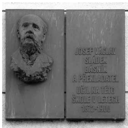
Pamětní deska J. V. Sládky na škole v Resslově ulici v Praze

At' padá sních a vichr ječí a listí rve a mrazí květ, — studánka čistá, — a jen větší kus nebe v ní je uvidět.