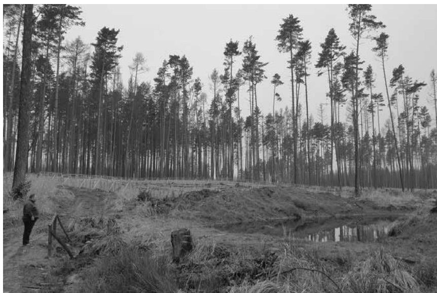
Jiří Nohel u nově zbudovaných rybníčků oživujících les

Příroda vysazuje do lesů břízy, duby, jeřáby a habry. Země se modlí zvláštním hlasem. Půjdu a udělám to samé.