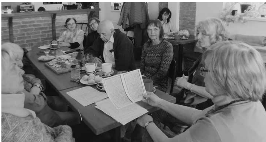
Z přednášky pro členy SAP konané 19. dubna 2022

To, že se osadu ani po několika letech snažení nepodařilo založit a uvést v život, nikterak neubírá na obsahu a důležitosti její myšlenky.