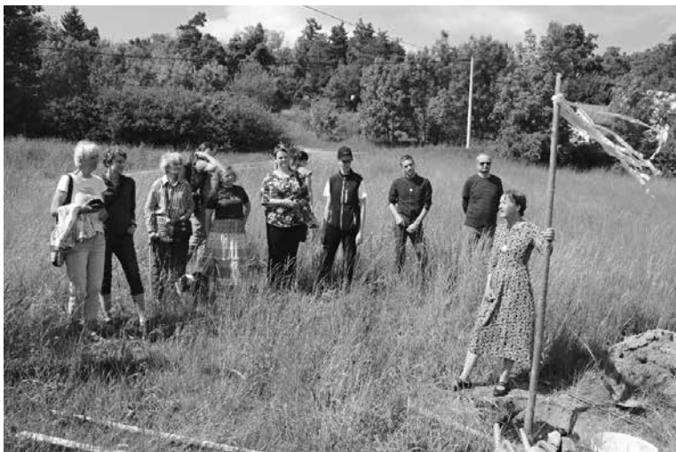
Sázení pamětního stromu na louce u hřbitova ve Žďárce