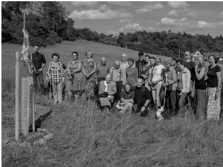
Účastníci vzpomínkového setkání ve Žďarci 22. května 2022