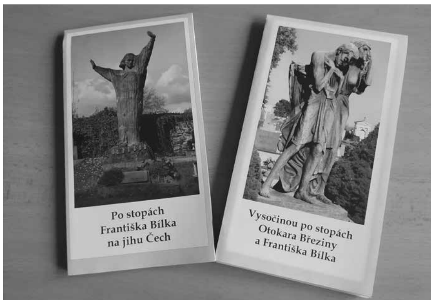
Literární mapy vydané Společností Františka Bílka

Agilní Společnost Františka Bílka vydala letos na jaře s finanční podporou vodohospodářské společnosti ČEVAK již druhou specializovanou literární mapu. K jejímu spoluautorství byla přizvána i naše SAP. Po první mapě Po stopách Františka Bílka na jihu Čech se nová mapa Vysočinou po stopách Otokara Březiny a Františka Bílka zaměřuje širěji a na nám bližší oblast. V mapovém obsahu jsou označena místa spojená se životem obou přátel a také místa spojená se životem Jakuba Demla a Anny Pammrové, která mohou zájemci při svých cestách Vysočinou navštívit. Na druhé straně mapy pak zájemci najdou medailonky všech čtyř osobností a stručný popis zahrnutých míst. Připojena je i jejich lokalizace pomocí GPS souřadnic. Mapy budou postupně předány do informačních center v dané oblasti a pro zájemce budou k dispozici zdarma.