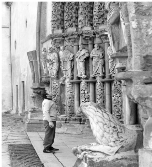
Restaurátor hodnotí své dílo

Tento výčet je shrnutím mých restaurátorských prací v areálu klášterních budov v Předklášteří.