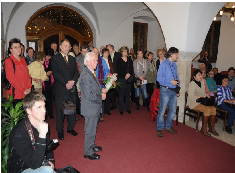
Vernisáž výstavy Krajinou řeky Svratky ve Žďáře nad Sázavou

Věřím, že ve dnech 12. – 26. října 2013, kdy bude cyklus Krajinou řeky Svratky vystaven v Černé Hoře, potěší další diváky.